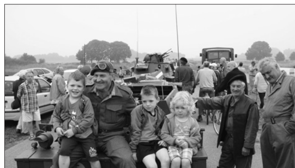
De rijders van de voertuigen poseren enthousiast met kinderen die met hen op de foto willen. De voertuigen zijn privé bezit van alle deelnemers. Met grote zorg zijn ze in geheel authentieke staat gebracht. Ook de eigen kleding klopt precies met wat de militairen in 1944 droegen. Helaas bleek dat de 70 jaar oude voertuigen, ondanks alle goede zorgen, nog wel eens met pech uitvallen. Daardoor was de stoet slechts zo'n 15 voertuigen groot in plaats van de verwachte 45.