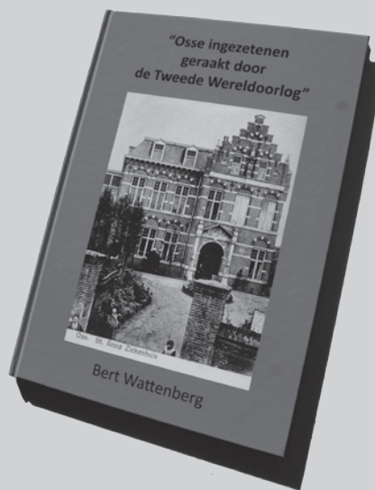
Het boek 'Osse ingezetenen geraakt door de Tweede Wereldoorlog' door Bert Wattenberg

In het voorjaar van 2014 verscheen een prachtig boekwerk over Joodse ingezetenen van Oss die in de Tweede Wereldoorlog zijn vermoord. Het betreft het boekwerk: "Stilstaan bij de Struikelstenen in Oss ". Daaraan heb ik zijdelings nog een bijdrage kunnen leveren in de vorm van foto's.