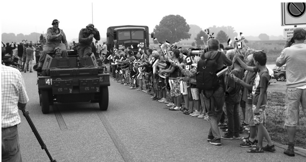
De eerste voertuigen van de stoet Engelse legervoertuigen komen op de brug van Keent aan. Heel toepasselijk zijn dit licht gepantserde verkenningsvoertuigen. Schoolkinderen uit Overlangel zwaaien even enthousiast naar de stoet als 70 jaar geleden.