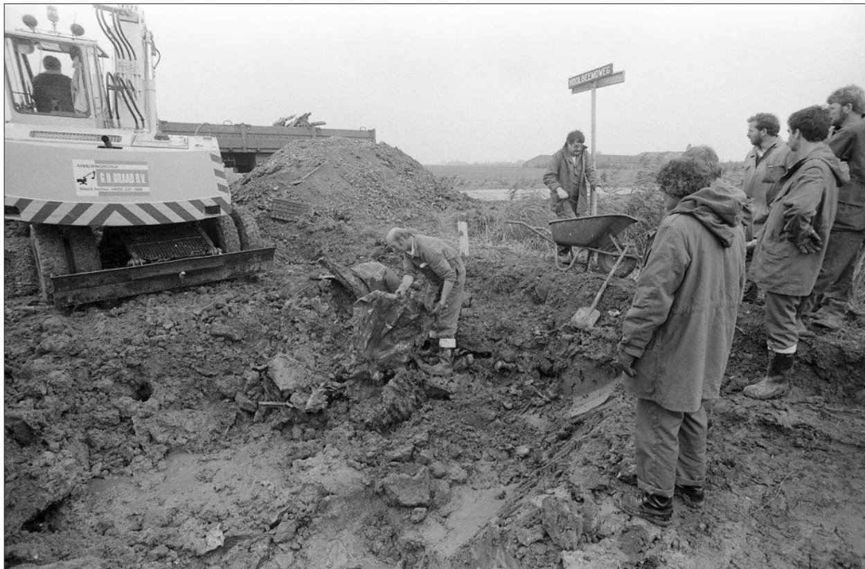
Graven in het verleden, een archeologische bezigheid waarbij veel handen het werk licht maken. Daarnaast heeft destijds de fotograaf, Ruud Rogier, zijn best gedaan geografische gissingen uit te sluiten. Met dank aan het Stadsarchief van de gemeente Oss.