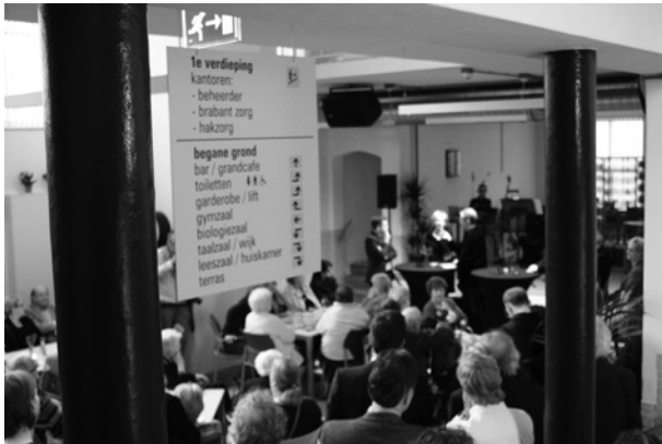
Op het verwijfsbord staan de namen van de verschillende ruimten, lokalen zijn passend vernoemd naar oude schoolvakken, zoals de biologiezaal en de taalzaal.