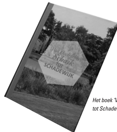
Het boek 'Van Osscher Schaik tot Schadewijk'