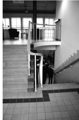
Het karakteristieke trappenhuis met dubbele opgang en gele vloertegels.