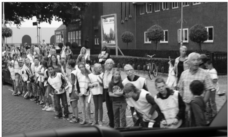
Bij het TitusBrandsmalyceum in Oss staan schoolkinderen, met achter hen de foto die Leo van den Bergh op 19 september 1944 maakte toen de Engelse bevrijders voor hun school door de Molenstraat reden.