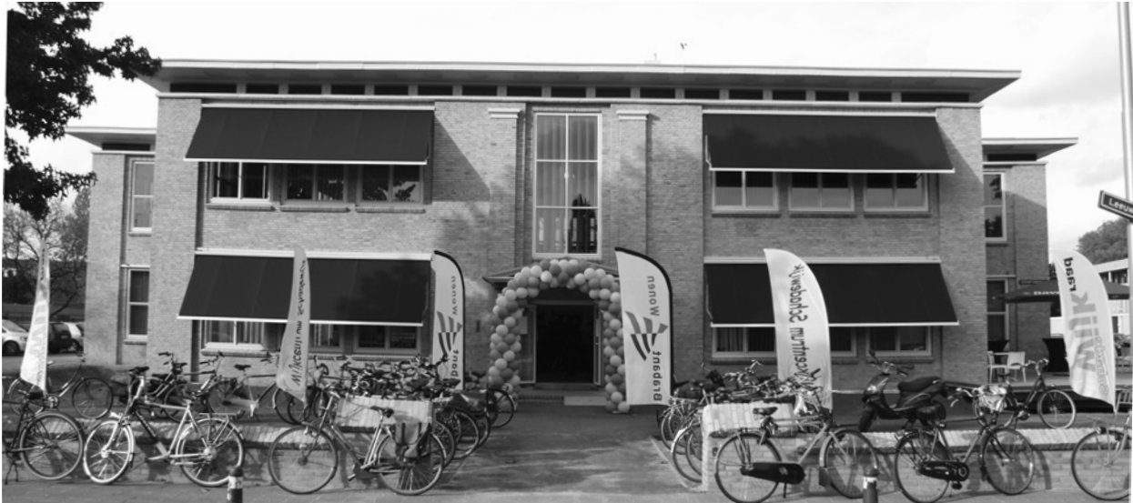
Wijkcentrum Schadewijk-Maria Gorettischool bij de opening op 10 oktober 2014. Een pracht van een centrum en monument voor de wijk.