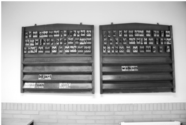
Een grote leesplank aan de muur herinnert aan de manier waarop generaties kinderen leerden lezen op de Maria Gorettischool.