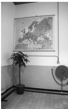
Een topografische kaart van heel West-Europa siert een hoek van de hal.