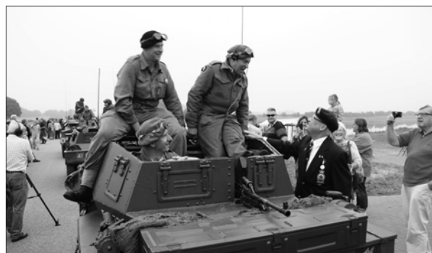
Een vertegenwoordiger van de Canadese organisatie van veteranen, overgekomen voor de herdenking van Operatie Market Garden, maakt een praatje met Engelse 'militairen' die met hun gepantserde verkenningswagen voorop gaan in de stoet voertuigen die van Keent naar Oss rijden.