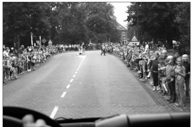
Schoolkinderen van Berghem juichen de kolonne enthousiast toe.