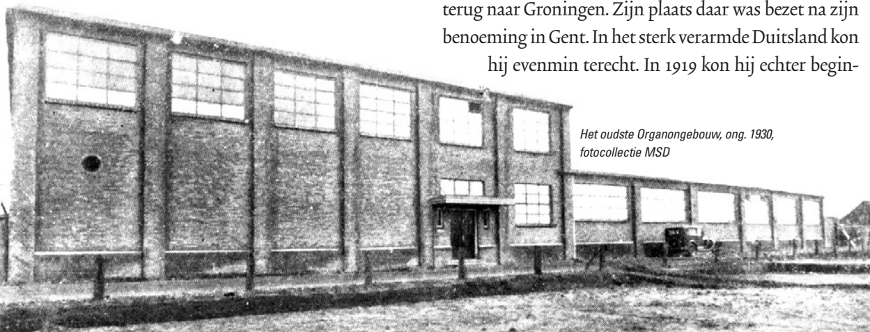
Het oudste Organongebouw, ong. 1930