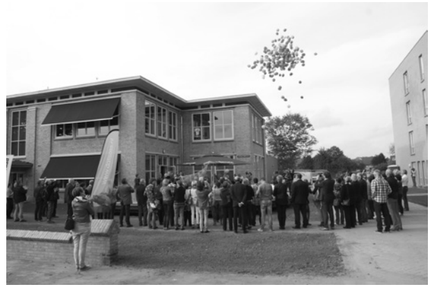
Met het loslaten van een grote wolk ballonnen weet heel Schadewijk dat het wijkcentrum geopend is.