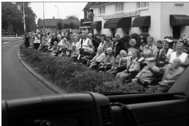
De kolonne militaire voertuigen rijdt Herpen binnen. De bewoners van het huis voor ouderen verwelkomen de stoet. Er waren mensen bij die zeventig jaar geleden de bevrijders hebben zien binnentrekken.